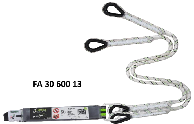
FA 30 600 13