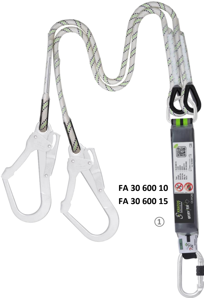
FA 30 600 10 FA 30 600 15